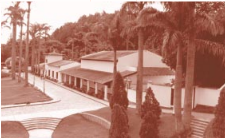
CASA DEL RECTORADO