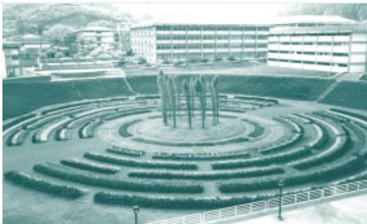
CRUZ DIEZ. Laberinto Cromovegetal (o Phisichromie). 1989.