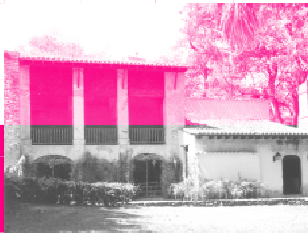
Trapiche Núcleo del Litoral USB. Mediados del siglo XIX