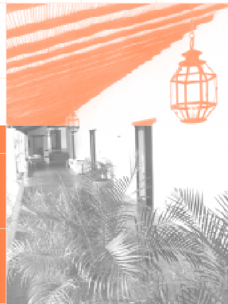
Interiores Casa Rectoral